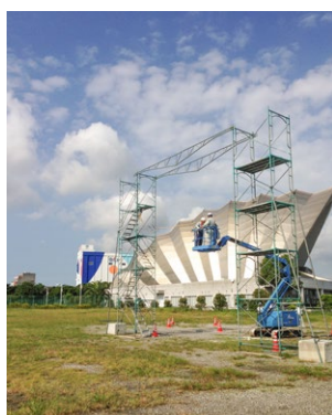
▲高所作業車の実技講習(平成28年度)の様子