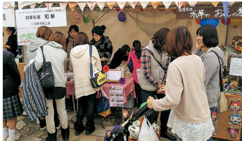
※写真は昨年の様子です。