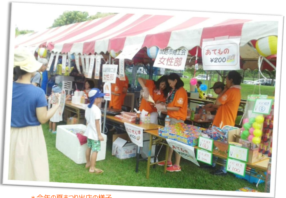
＊今年の夏まつり出店の様子